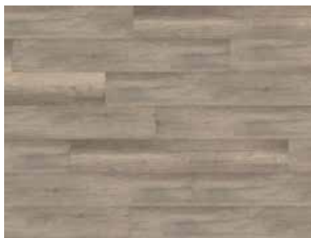
Calistoga Grey Varenr. 10200212