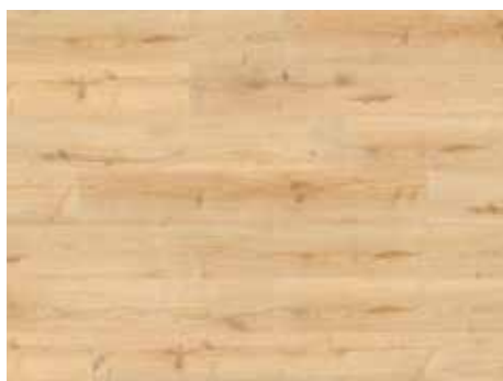
Garden Oak Varenr. 10200214