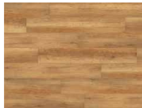
Calistoga Nature Varenr. 10200213