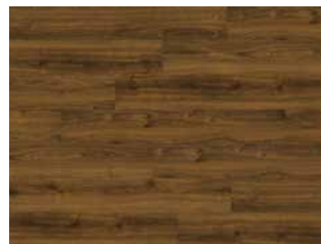
Dakota Oak Varenr. 10200216