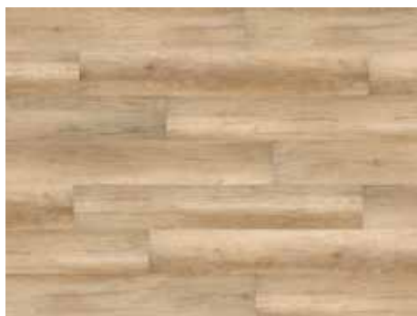
Calistoga Cream Varenr. 10200211