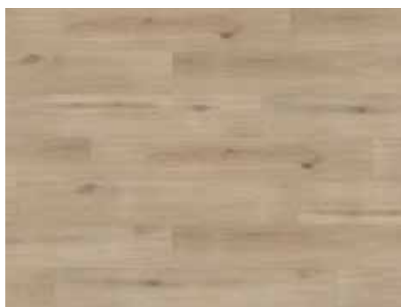
Island Oak Sand Varenr. 10200215